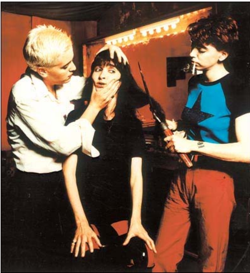
המכשפות. "אנשים רואים בנות שמנגנות על כלים גבריים וישר מדביקים להן סטיגמה"

סגרתי מעגל והבנתי שהיה טוב, הכי טוב, אבל זה נגמר. אני טיפוס מאוד נוסטלגי. מאוד קשה לי להתמודד עם מוות. אחרי שענבל נהרגה לא רציתי לעשות כלום. הייתי יושבת שעות, מסתכלת על הקיר ובוכה. יכולתי לשמוע פתאום את 'כשזה עמוק', השיר הכי חזק שלה, ולא משנה מה הייתי עושה באותו רגע, ישר הייתי פורצת בבכי. הייתי מחפשת אותה כל הזמן".